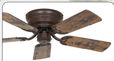
FLAT 103-III BZ #5103371 Gehäuse Bronze, 5 Wende- flügel Altholz Eiche (sichtbar)/Eiche kolonial