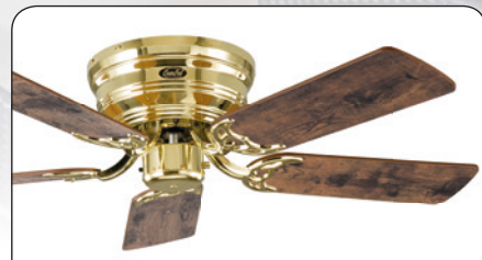
FLAT 103-III MP #5103001 Gehäuse Messing poliert, 5 Wendeblätter Altholz Eiche (sichtbar)/Ahorn