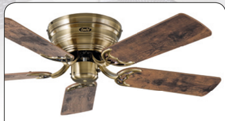
FLAT 103-III MA #5103041 Gehäuse Messing antik, 5 Wendeblätter Altholz Eiche (sichtbar)/Ahorn