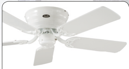
FLAT 103-III WE #5103061 Gehäuse Lack weiß, 5 Wendeblätter Lack weiß (sichtbar)/Lichtgrau