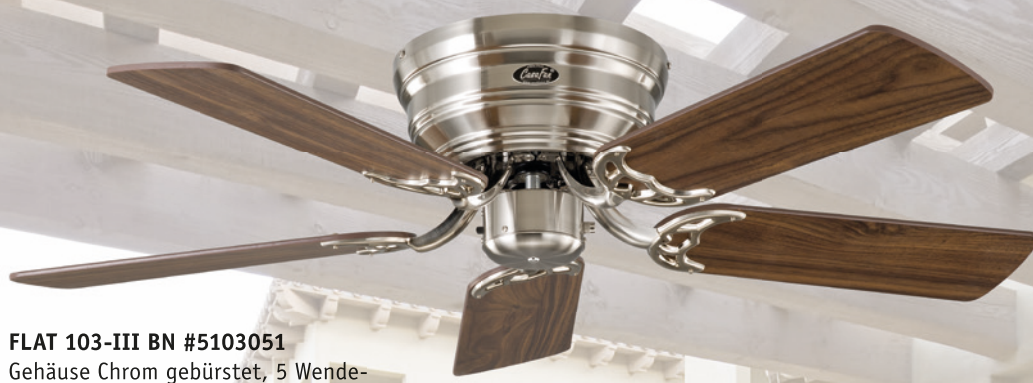
FLAT 103-III BN #5103051 Gehäuse Chrom gebürstet, 5 Wende- flügel Nussbaum (sichtbar)/Buche

■ Wendeblätter aus Holz mit zwei unterschiedlichen Dekoren ■ absolut ruhiger Lauf EXTRAFLACH! Besonders geeignet für niedrige Räume