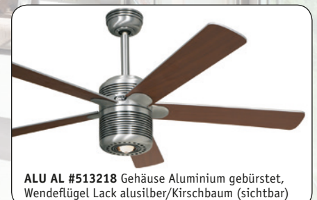
ALU AL #513218 Gehäuse Aluminium gebürstet, Wendeflügel Lack alusilber/Kirschbaum (sichtbar)

ALU AL #513218 Gehäuse Aluminium gebürstet, Wendeflügel Lack alusilber (sichtbar)/Kirschbaum