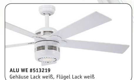
ALU WE #513219 Gehäuse Lack weiß, Flügel Lack weiß