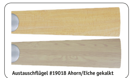
Austauschflügel #19018 Ahorn/Eiche gekalkt